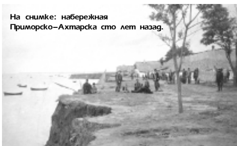
На снимке: набережная Приморско-Ахтарска сто лет назад.

влечение. Но вскоре всё изменилось, и вместо вина на столе в качестве напитков появились лимонад и фруктовая вода. А для того, чтобы собраться всем вместе, общество строило чайно-читальни, украсив их картинами из отечественной истории, различными музыкальными инструментами, разнообразными настольными играми. А также, строили сцены, на которых активисты устраивали любительские спектакли для народа.